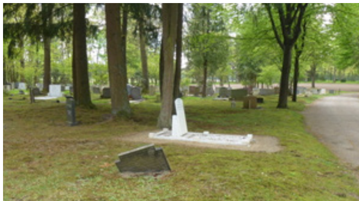
In Bredevoort komt een natuurlijke begraafplaats. (gewone begraafplaats)

Een deel van begraafplaats Kloosterdijk in Bredevoort wordt de komende tijd ingericht als natuurlijke begraafplaats. Drie andere, oude begraafplaatsen worden gesloten voor nieuwe begravingen. De gemeente Aalten past het beleid aan vanwege de stijgende kosten van onderhoud en beheer.