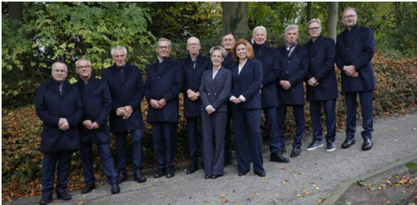
De kleur van de nieuwe pakken is donkerblauw.

MEDEMBLIK - Bij uitvaartvereniging De Eendracht in Medemblik is afgelopen jaren veel vernieuwd en ontwikkeld. De vereniging verzorgt alle aspecten rond de uitvaart een respectvolle, passende en praktische dienstverlening.