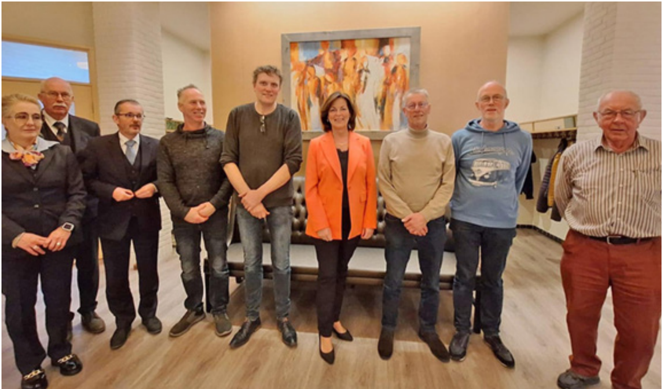
DELU Hoogeveen verwelkomt leden van Begrafenisvereniging Witharen e.o.