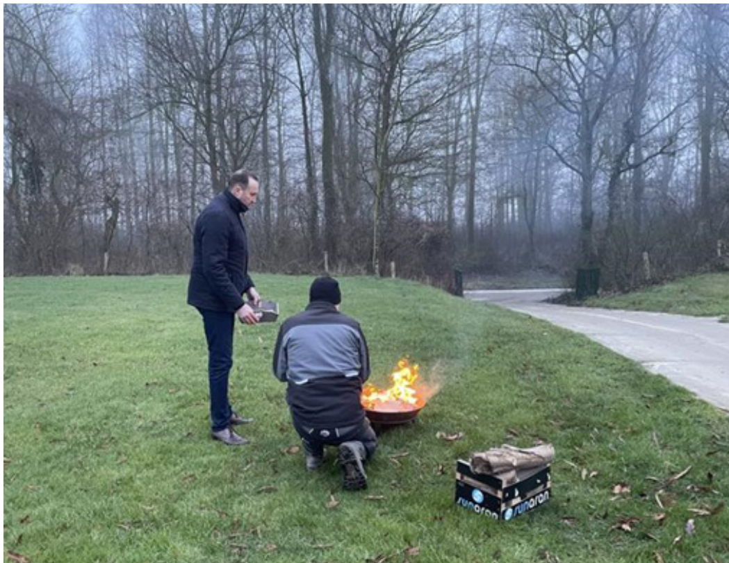
Verbranding van 'Hemelpost'.

In aanwezigheid van een vertegenwoordiging van de gemeente Dronten, medewerkers van begraafplaats De Wissel, Volatus Uitvaartzorg en rouwbegeleider Eva de Vries-Holkamp vond donderdagochtend 6 februari op de Dronter begraafplaats volgens protocol een rituele verbranding plaats van post uit de brievenbus 'Hemelpost'. Na het voorlezen van een gedicht werden de brieven en tekeningen in stilte verbrand.