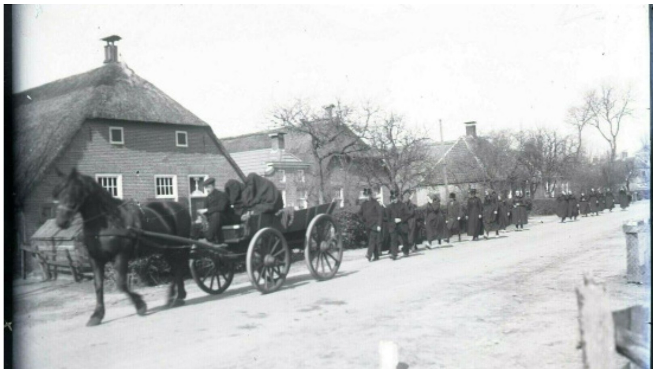
Drentse begrafenisstoet plm. 1940. Twee vrouwelijke verwanten zitten op de kist. Ze dragen een zwart rouwkleed dat het hele lichaam bedekt.

De planken voor de doodskist had je al in huis, de buren verzorgden de uitvaart tot en met het delven en het dichtgooien van het graf, na de begrafenis at men stokvis en dronk men warm bier. Willy Weerman vertelt over Drentse gebruiken van weleer.