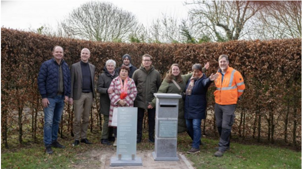
Brievenbus voor hemelpost op de begraafplaats Wieringerwaard

Op de begraafplaats van Wieringerwaard is woensdag de eerste brievenbus voor hemelpost onthuld. Het idee is dat rouwverwerking goed werkt als mensen het van zich af kunnen schrijven. Voor kinderen is het maken van een tekening die kan worden gepost ook goed om rouw een plekje te geven.