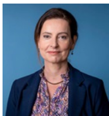
Judith Uitermark | Minister van BZK Judith Uitermark | Minister van BZK 7.730 followers

Nederland Uitvaartorganisaties Nederland is een uniek samenwerkingsverband tussen elf branche- en beroepsorganisaties in de uitvaartsector. Wij werken samen aan goede uitvaartzorg. Het samenwerkingsverband bestaat uit: BGNU, BRANA, FKB, LBvR, LOB, LVC, Nardus, NIT, NU, Stille Zorg en VTU.