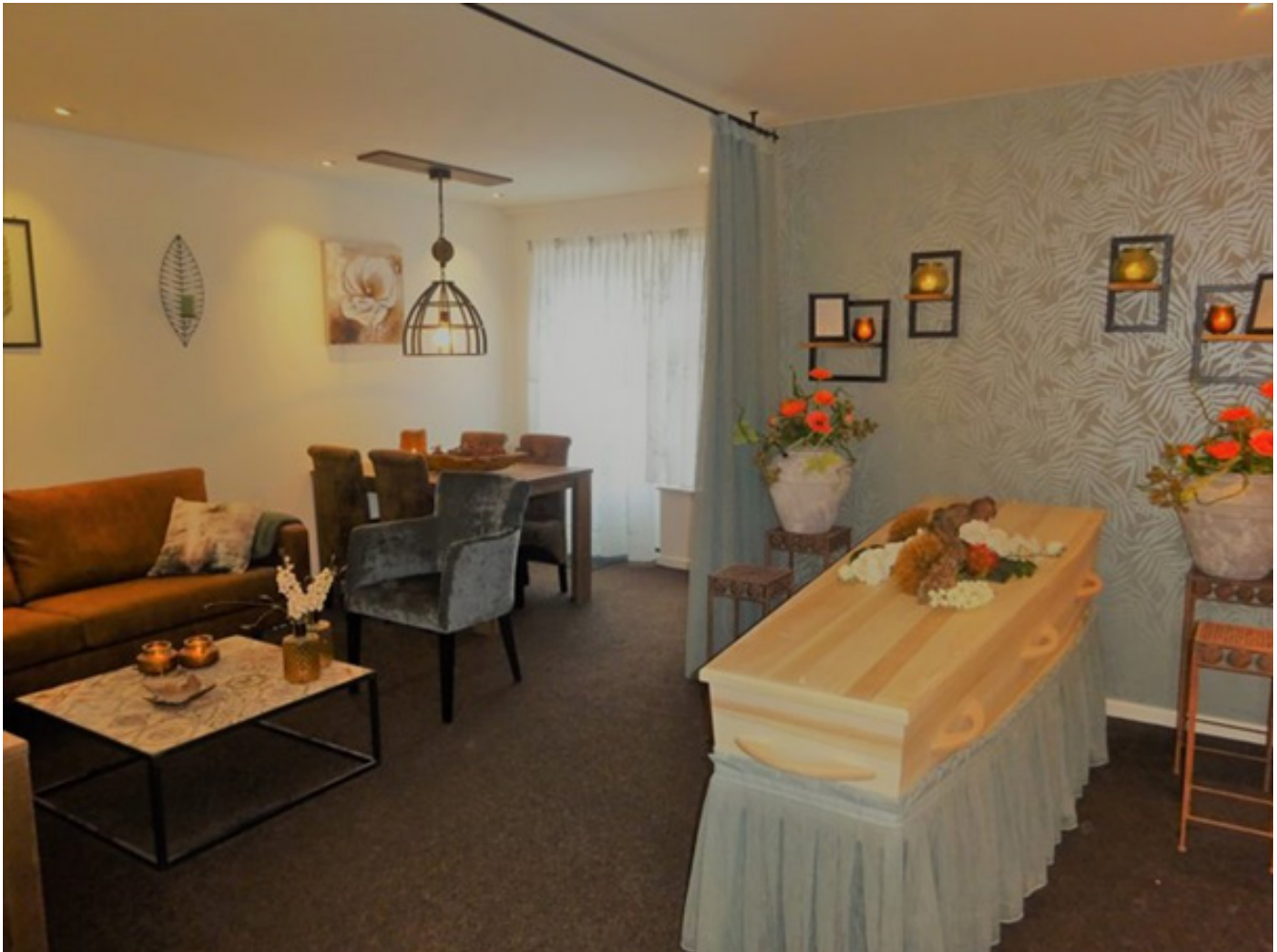
De Libellekamer van het Uitvaarthuys - De Ruiter Uitvaartzorg