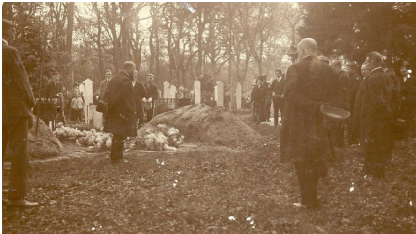
Begravenis Veenhuizen plm. 1930.