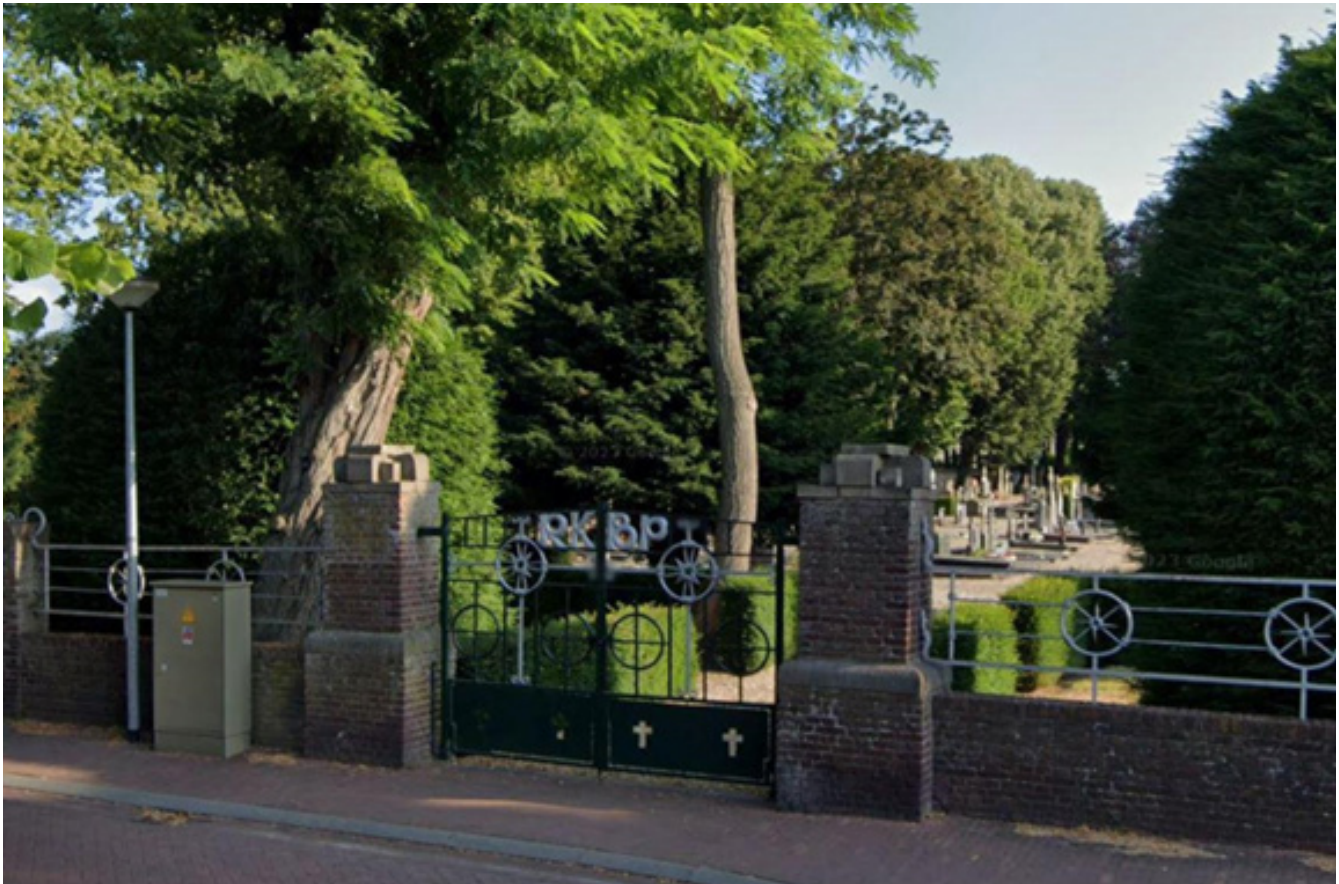
Het Sint Martinuskerkhof in Weert.

„Er is een groep inwoners die vindt dat de Sint-Martinuskerk bij Weert hoort, terwijl ze zelf niet zo kerkelijk zijn”, zegt Honings. Hij vindt dat zij ook ervoor moeten kunnen kiezen hun uitvaart op die iconische plek te laten plaatsvinden.