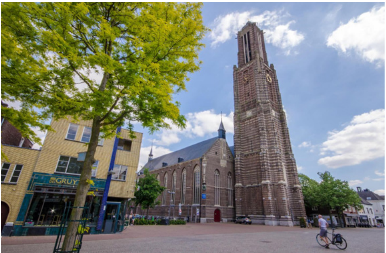
De Sint-Martinuskerk van Weert.

Mensen zijn steeds meer gewend afscheid te nemen in de aula van een crematorium of een andere afgehuurde (evenementen)locatie. Daar wordt dan vaak herdacht wie de overledene was.