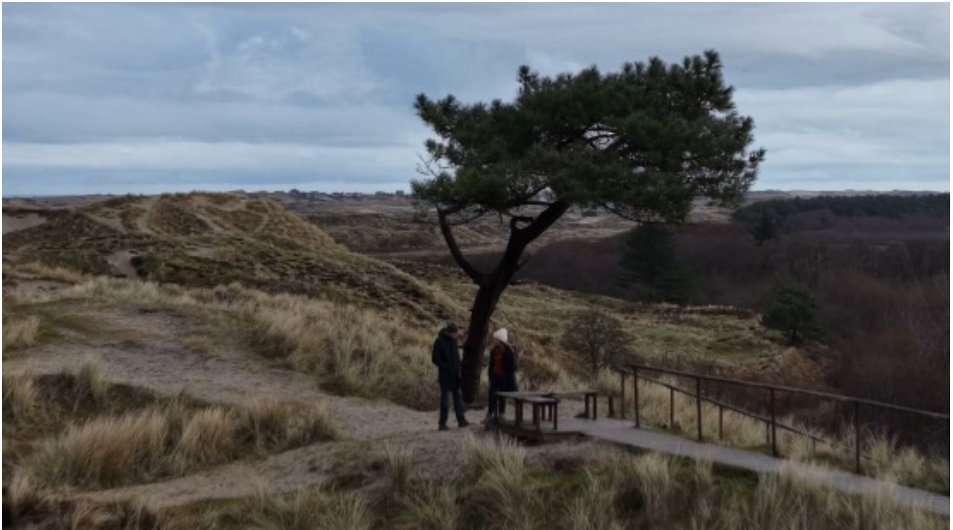
Uitzicht over Terschelling

Het zaadje voor het rouwpad werd achteraf al geplant, al dachten ze daar op dat moment helemaal niet aan. De rouwstoet naar het strand was misschien wel de eerste stap naar het rouwpad.