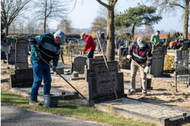
21 vrijwilligers onderhouden begraafplaats Rust Zacht in Wijhe