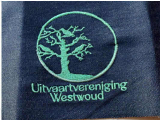
Nieuwe uitvaartvereniging, nieuw logo.

De Laatste Eer deed al regelmatig een beroep op dragers van In Paradisum. De nieuwe vereniging telt twaalf dragers. Per jaar zijn er in Westwoud gemiddeld tien tot vijftien uitvaarten die door de lokale verenigingen werden verzorgd. Waarbij al vele jaren een verschuiving is te zien van begraven naar cremen.