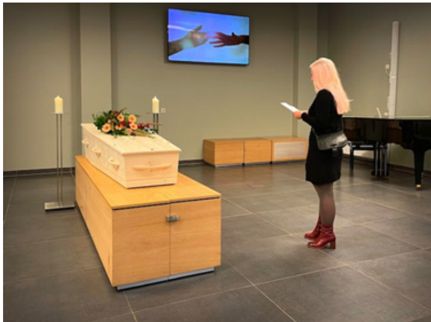
Een dichteres leest een gedicht voor bij een crematie.