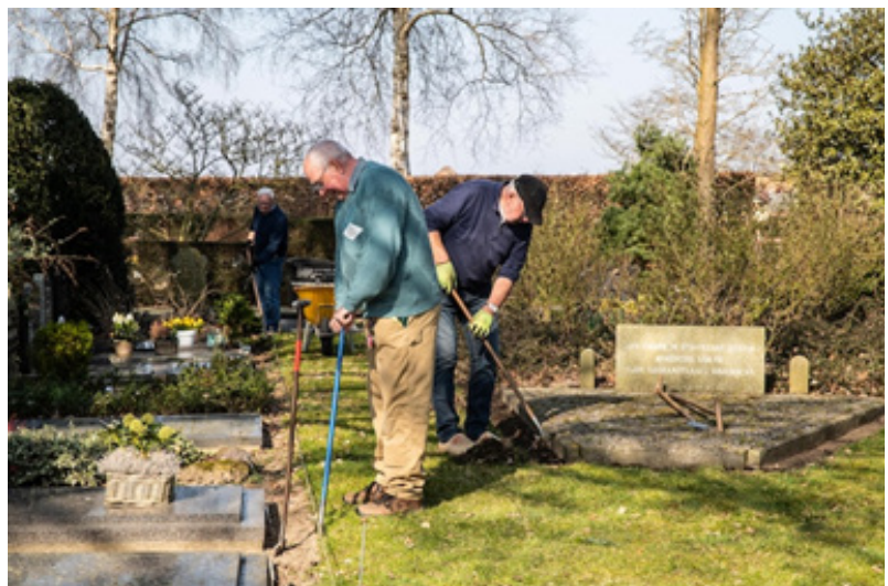
Graszoden kanten op Rust Zacht in Wijhe